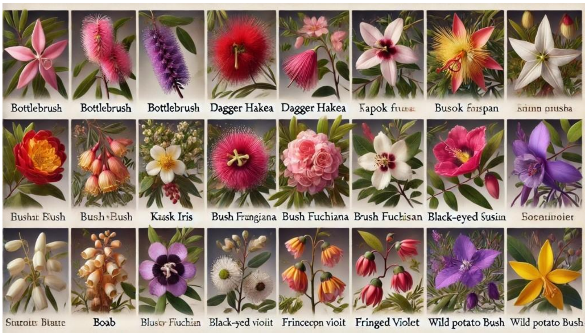
Tabel: 12 Australische Bloemen Bewustzijnsvelden: Energiestagnatie in de 12 hoofdmeridianen kan leiden tot lichamelijke, psychische en mentale klachten. Hiervoor helpen de Bewustzijnsvelden van de volgende 12 Australische Bos Bloemen ( Australian Bush Flowers ) om deze blokkades op te lossen en de energie weer vrij te laten stromen.